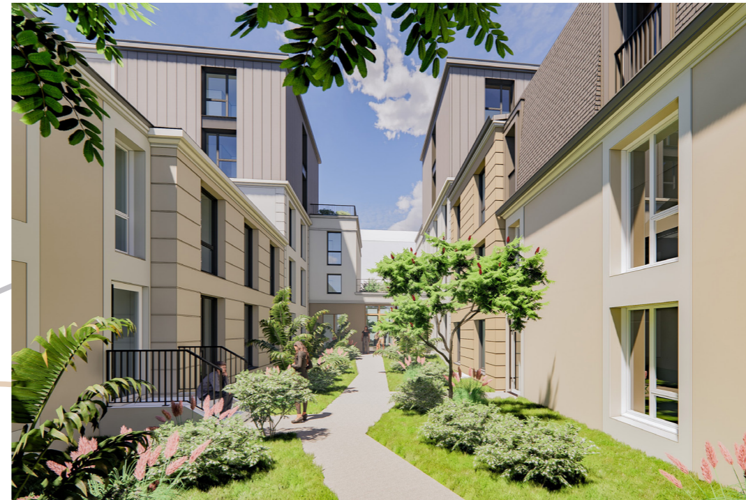
Cœur d'îlot végétal

Grâce à des loyers sécurisés, une gestion simplifiée et des avantages fiscaux attractifs, dont des loyers peu ou pas fiscalisés grâce à l'amortissement du bien, ce type d'investissement vous permet de générer des revenus stables, d'optimiser votre fiscalité et de développer votre patrimoine durablement.