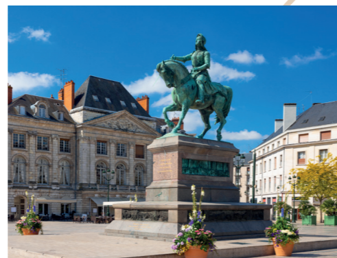
Place du Martroi

Pour les moments de détente ou les activités sportives, les quais de Loire et le parc Anjorant, situés à quelques minutes, offrent un cadre idéal pour se ressourcer en pleine nature.