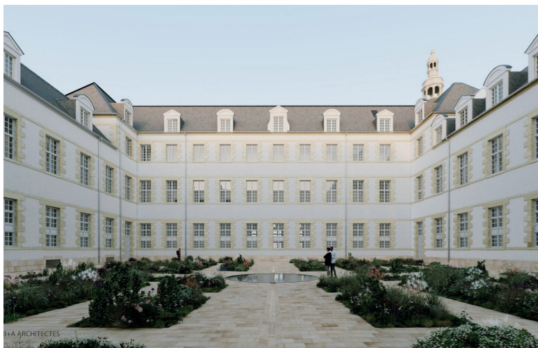
Future Faculté Droit Eco Gestion