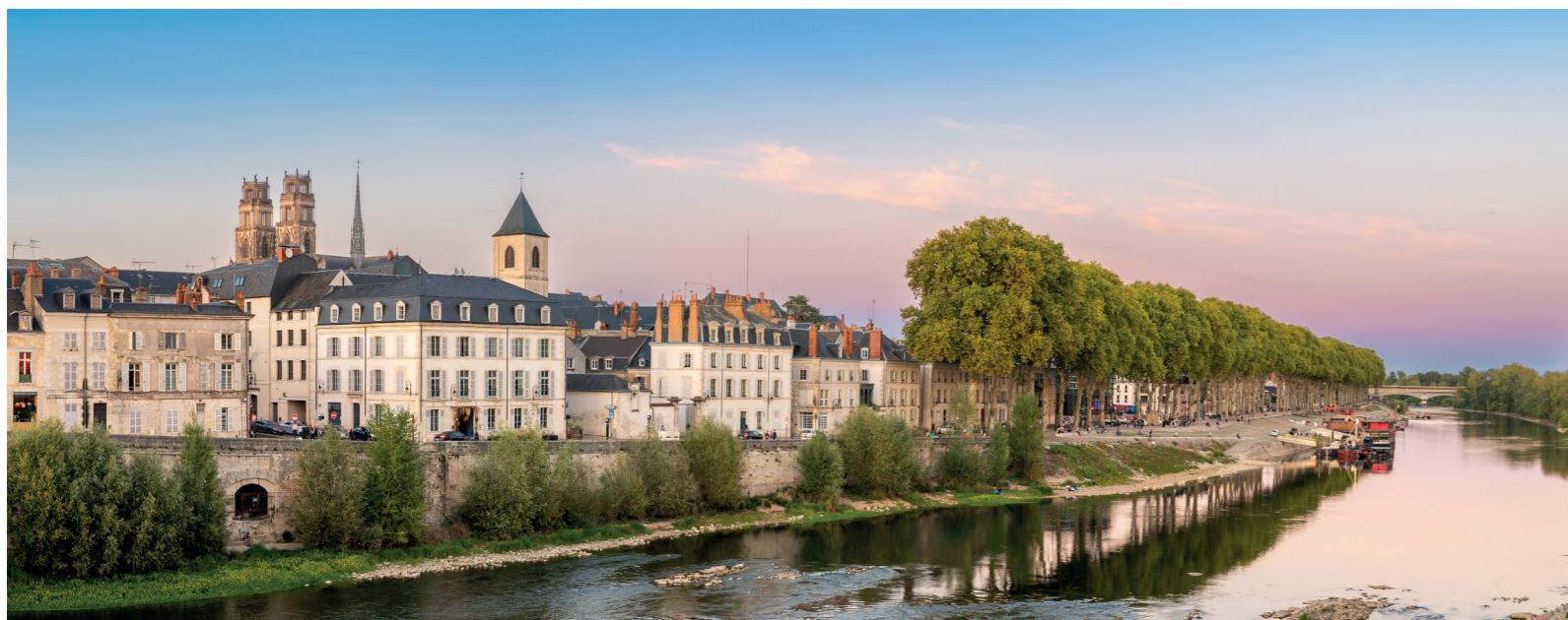
Bords de Loire